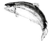
Lax från Skottland