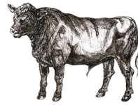
Aberdeen Angus nötkött