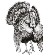
Norfolk svart kalkon