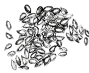
Brittiska kron linfrön